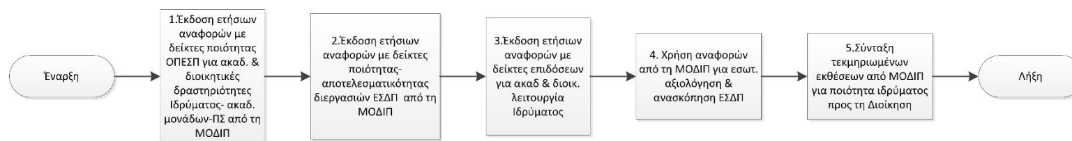
Σχήμα 5. 2 Διαδικασία 5.2